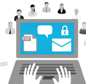
Gestione della Comunicazione via Web