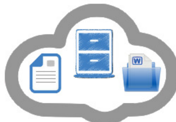
Archivio e Gestione dati e file